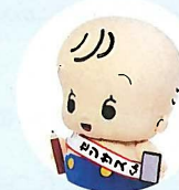
国勢調査 イメージキャラクター センサスくん