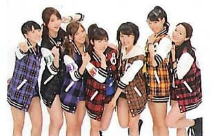
公式応援団 アップアップガールズ(仮)