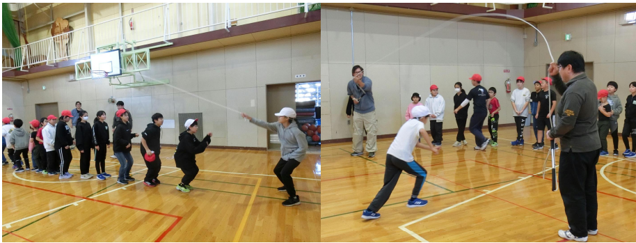
(写真は3～6年合同体育の様子です)