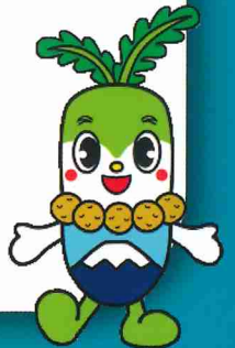
留寿都村キャラクター 「るすっぴー」

留寿都村では、小型家電リサイクル法認定事業者のリネットジャパンリサイクル(株)と連携協定を締結し、パソコン・小型家電を“便利”に“かんたん”に回収できる宅配リサイクルの活用を推奨しています。