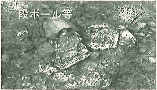
留寿都村内某所の野焼き跡

一部の例外を除き、厳しい基準をクリアした焼却設備以外(穴、ドラム缶、ブロックを積んだ簡易かまど、ストーブなど)でゴミを野外焼却することは、ゴミの野焼きとなります。 ゴミの野焼きは、廃棄物の処理及び清掃に関する法律違反で厳罰が科せられます。