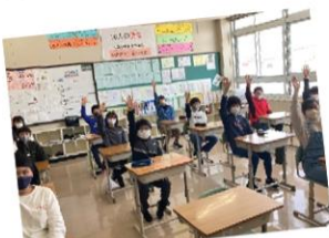
3/3 留寿都小学校6年生を迎える体験入学