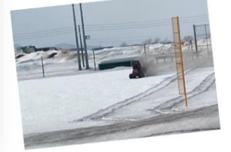
3/9 PTA 環境整備部 佐々木さんによるグラウンドの融雪剤散布ありがとうございました。