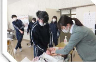
3/8 松本保健師、石川保健師による思春期教室(3年)