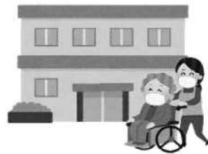
高齢者施設など に行くとき