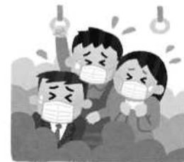
混雑した乗り物の中