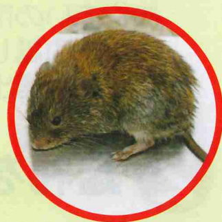
エゾヤチネズミ (体長10cm程度の小型のネズミです)