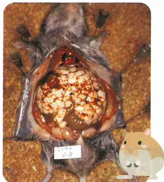
肝臓にエキノコックスが寄生した野ネズミ