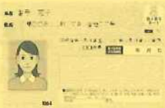
マイナンバーカード