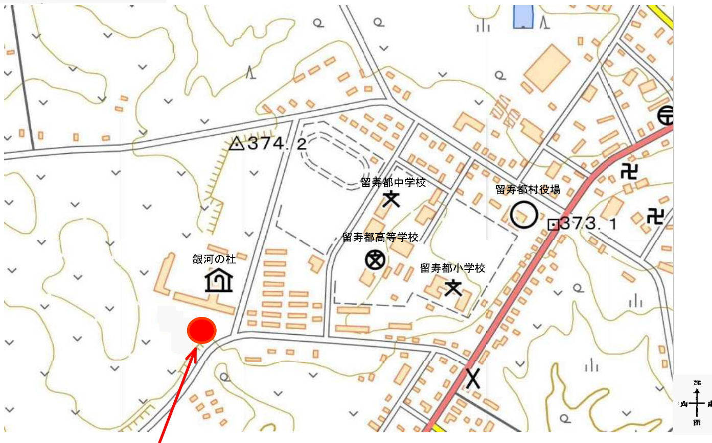
公募物件（字留寿都165番地 3,936.11㎡）

申込みされる際には、事前に現地をご確認ください。 なお、物件は現状引渡しとなります。