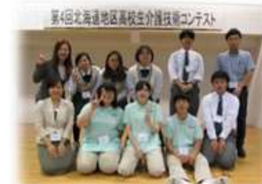
【日頃の学び、練習の成果 バッチリ! 皆さんお疲れさまでした】