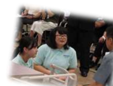
【利用者様への 語り掛け】