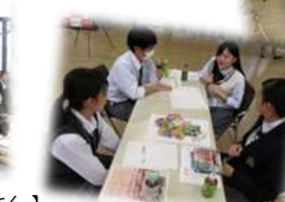
【コンテスト後の 交流会。各校交えて 盛り上がりました!】