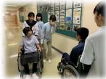
【 福祉コースでは車いす体験や 視覚障害者歩行介助などを体験 】

8月17日、留寿都高校1日体験入学が行われました。各方面から中学生が来校し、生徒が熱心に日々学んでいることを伝え、留寿都高校の魅力である農業、福祉をアピールする機会となりました。