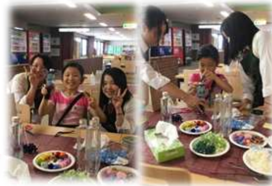
【 作成者が花を選び 綺麗に出来上がりました！ 】