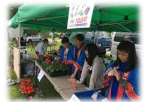
【 多くの方に購入いただきました。 ありがとうございました 】

私はJAようてい農業まつり、留寿都産業まつりの両日参加してきました。コミュニケーションの取り方など会話の勉強になりました。先生方の指導も受け、野菜の調理方法などを学び、お客様にミニトマトについて説明をして、購入していただいたときはうれしかったです。実習でもこの経験を生かしていきたいと思います。