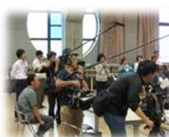
【今大会は取材陣がたくさん】