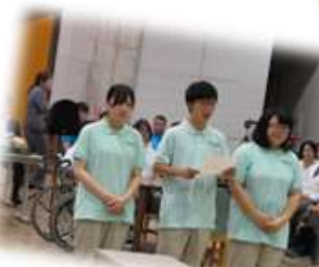
【アピールタイムでは 素敵な声量で会場を 魅了!】