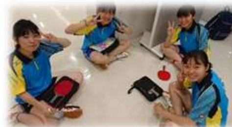
【試合前の笑顔 卓球団体】