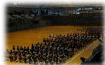
【全国から来る強豪選手】

神奈川県との3年生と対戦し、負けてしまいましたがとても楽しく試合をすることができました。来年はレベルアップしてまた全国大会目指して頑張りたいです。