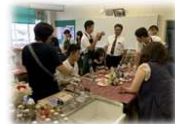
【 農業コースではハーバリウム作成を体験 】