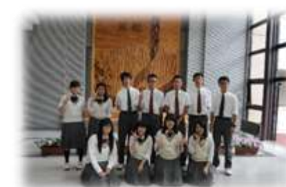
【留寿都代表 頑張ってきました!】