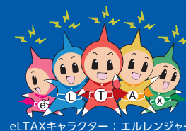
eLTAXキャラクター：エルレンジャー