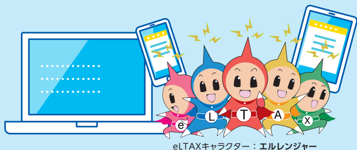
eLTAXキャラクター：エルレンジャー