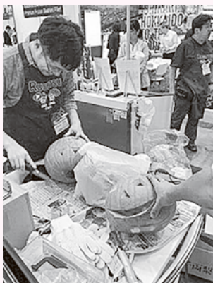
展示ブースの装飾に悪戦苦闘

良さや種類の豊富さを宣伝することができたのではないかと思います。二つ目は道の駅で販売されている道の駅記念切符のデザイン制作をさせていただきました。兼ねてより道の駅庄主主任からお話をいただき、この度販売までに至りました。貴重な機会をいただくことができ本当にありがたかったです。興味のある方は是非実物を手に入れてください。